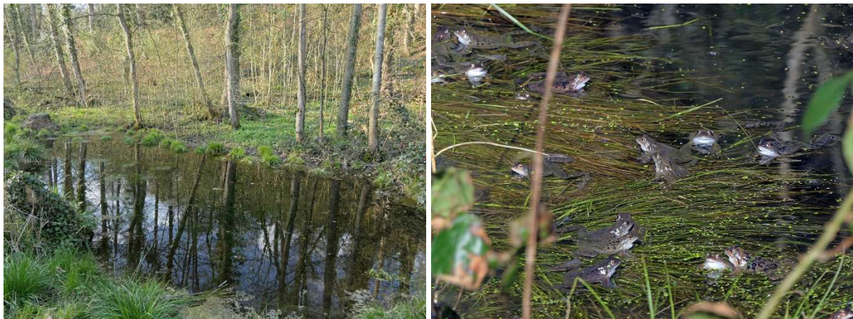
Abb. 12: Bruchwaldaspekt mit Weiher am Oefter Bach (durch Waldweg getrennt), östlich vom Bucker Hof; Laichgewässer von – zumindest – Grasfrosch und Fadenmolch.