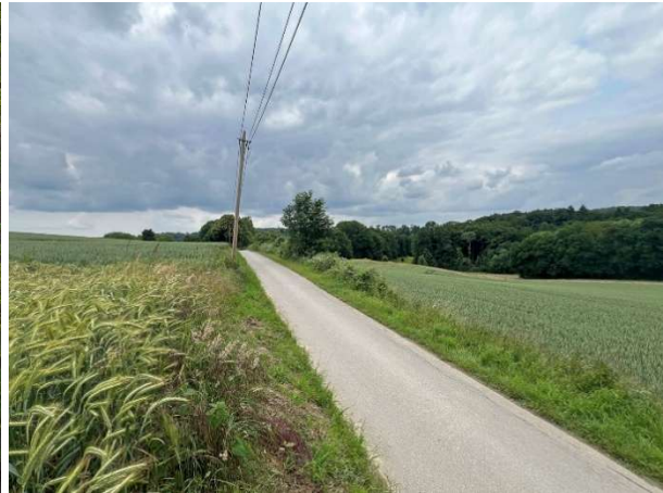
Abb. 2: Getreidefelder oberhalb von Hof Nipshagen (Oefte 13).