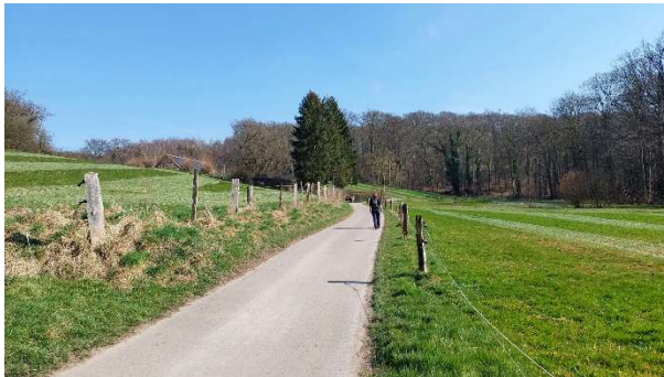
Abb. 3: Dauergrünland (Weideflächen) am Bucker Hof (Oefte 20).

Prägend sind überdies die parkartigen Aspekte einer ausgedehnten, bereits seit 1959 existierenden Golfanlage. Zu den markanten Besonderheiten zählt das Haus Oefte (auch Schloss Oefte) nahe der Ruhr (Abb. 4) und der das Gebiet durchfließende Oefter Bach (Abb. 5), Zentrum des knapp 30 ha umfassenden Essener Naturschutzgebietes Oefter Tal (Kennung E-010).