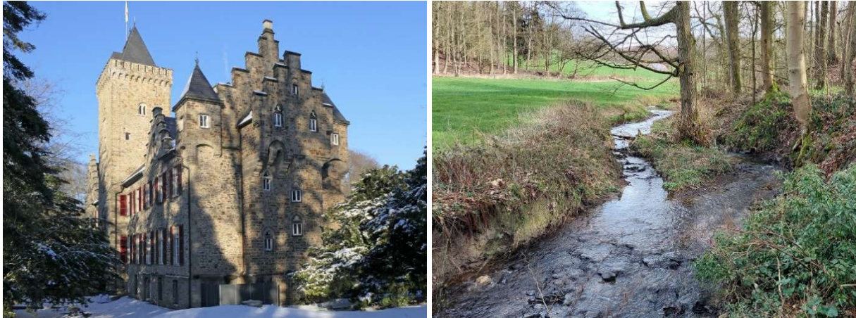
Abb. 4: Haus Oefte (auch Schloss Oefte).