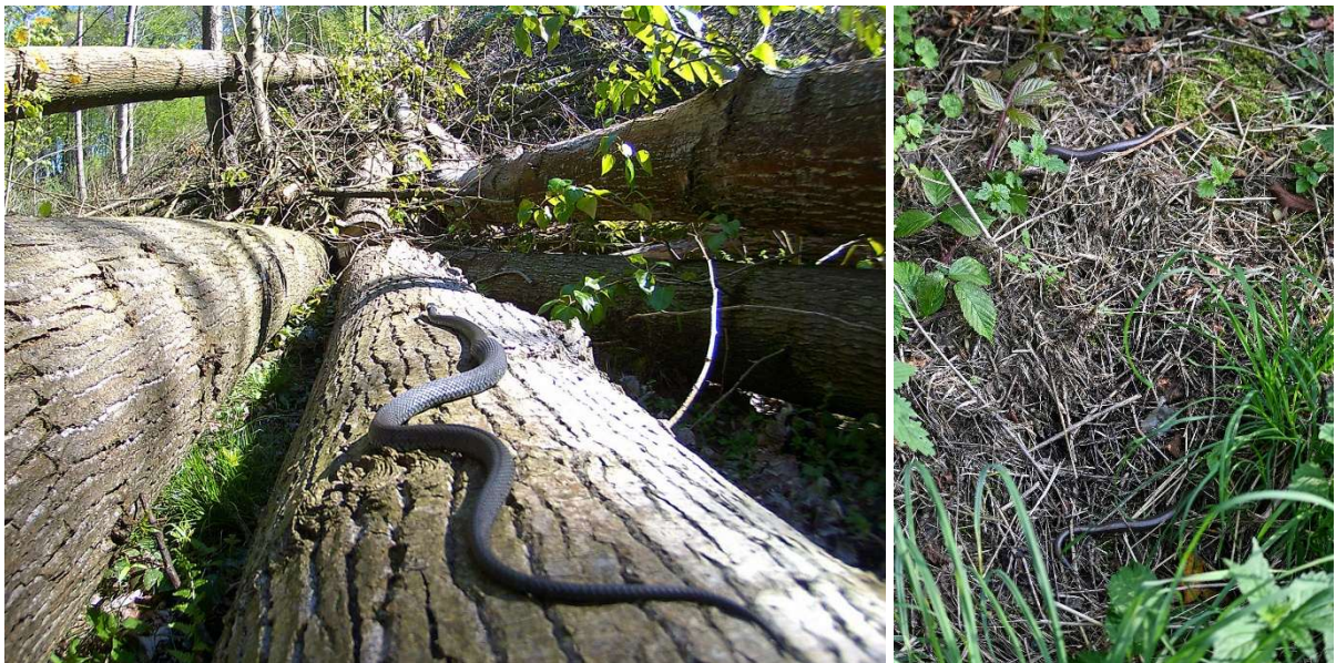
Abb. 10: Adulte Ringelnatter, April 2019. (Foto: M. Schmitt)

Unter den anderen Wirbeltieren stach als Spezies der Roten Listen neben dem Feldhasen (ein Exemplar 2020, drei 2025) vor allem die Ringelnatter hervor, von der zwei Beobachtungen gelangen. Da im Gebiet Mischformen zwischen den mittlerweile zwei anerkannten heimischen Ringelnatterspezies ( Natrix natrix bzw. Natrix helvetica ) auftreten könnten (Schlupmann 2018), möchten wir uns nicht auf eine Art festlegen. Dies zumal es sich im ersten Fall um ein sehr dunkles Exemplar handelte (Abb. 10), im zweiten Fall um die papierdünne „Mumie“ eines mehrfach überfahrenen Jungtieres (2.6.2023 bei Oefte 4). Bei beiden Tieren war die für die Artbestimmung aufschlussreiche Körperzeichnung nicht genau zu erkennen. Ein drittes Exemplar, ebenfalls eine überfahrene Jungschlange, fand sich am 12.5.2025 etwas nördlich außerhalb unseres Erfassungsgebietes am Westende des Kutschenwegs in Essen-Heidhausen. Die Blindschleiche (in NRW auf der Vorwarnliste der Roten Liste geführt) wurde 2023 und 2025 jeweils mit mehreren Individuen, darunter auch Totfunde, festgestellt (Abb. 11). Der Grasfrosch, gleichfalls auf der NRW-Vorwarnliste, hat ein Laichgewässer in einem Bruchwaldbereich der Aue des Oefter Baches (Abb. 12), wenige hundert Meter südwestlich von Oefte 20 (Bücker Hof). Hier hatten sich am 14.3.2024 40 bis 50 Frösche eingefunden (Abb. 13); auch drei Männchen des Fadenmolches konnten am 17.4.2023 in diesem ungefähr 50 m 2 großen Weiher registriert werden.