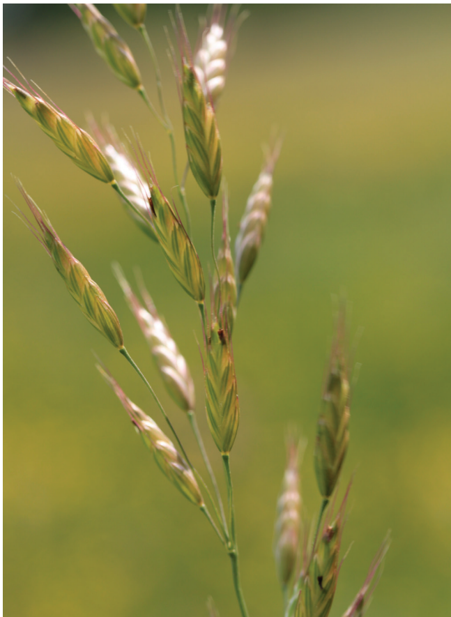
Abbildung 130: Trauben-Trespe ( Bromus racemosus )

nur lokal innerhalb anderer Feuchtwiesenbestände an besonders nassen Standorten auf.