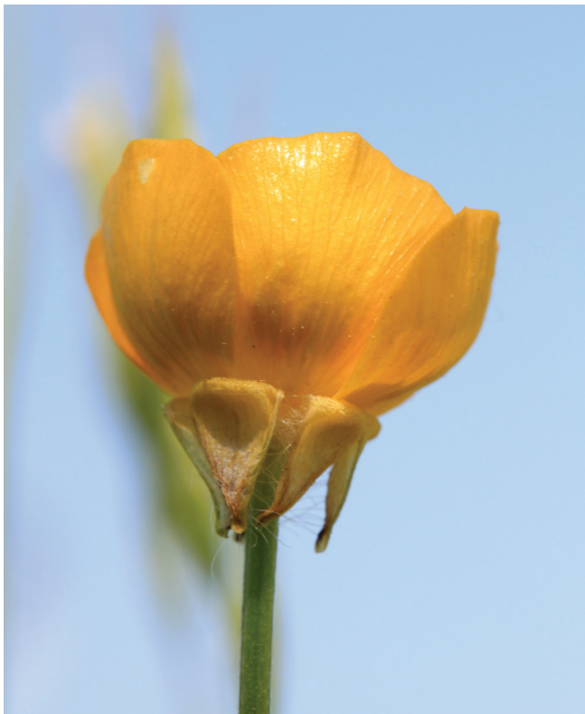
Abbildung 129: Knolliger Hahnenfuß ( Ranunculus bulbosus )

Dennoch sei an dieser Stelle erwähnt, dass solche Bestände selbst im Kernruhrgebiet an wenigen Stellen existieren und selbstverständlich von herausragendem naturschutzfachlichem Wert sind.