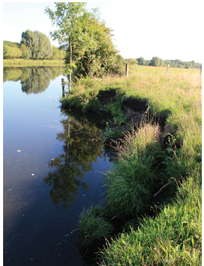
Abbildung 125: Südwestliche Abbruchkante im Ruhrbogen mit ruderaler Magerwiese im Oberbereich

Auch bei der nordöstlichen Fläche weist die Kante selber kaum Aufwuchs auf, während die oberhalb lie-