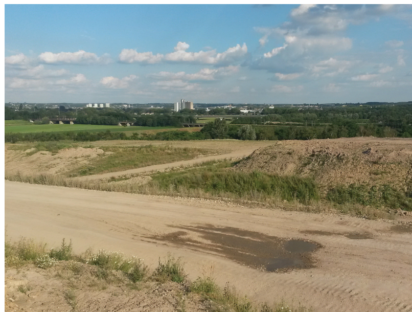
Abbildung 126: Die Bodendeponie im Ruhrbogen am Kolkerhofweg

Kreuzkröten ( Bufo calamita RL NRW 3, NRTL 3) nutzten verschiedene Lachen auf der Deponie als Laichplatz, was durch Laich, Larven und nächtliche Rufe vielfach nachzuweisen war. Allerdings war der Fortpflanzungserfolg wegen der geringen Niederschläge im Sommer sehr schlecht. Gute Reproduktion wurde dagegen in dem Gewässer festgestellt, dass der Ruhrverband als CEF-Maßnahme angelegt hatte. Hier hat sich auch eine Teichmolch-Population etabliert, was aber zugleich zeigt, dass die Wasserführung hier inzwischen zu dauerhaft ist (auch erkennbar an den vielen Wasserkäfern). Bei nächtlichen Kontrollen wurden auf der Deponie selber viele adulte und einige halbwüchsige Kreuzkröten, in Randbereichen und auf dem Weg hin-