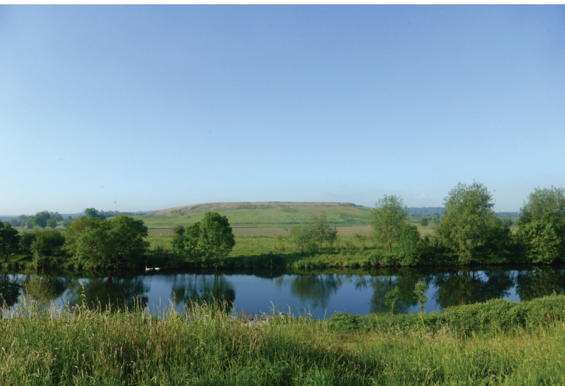
Abbildung 127: Blick von Oberhausen-Alstaden über die Ruhr auf die Mülheimer Bodendeponie

ter der südlich angrenzenden Bahnlinie wurden auch viele Erdkröten gefunden.