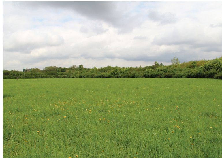
Abbildung 124: Wiese mit Dauermonitoringflächen im Ruhrbogen

Im Jahr 2014 wurden im Rahmen eines Projektes zur Uferentfesselung am Ruhrbogen an zwei Stellen Abbruchkanten abgegraben und umzäunt (Abbildung 125). Diese wurden im aktuellen Jahr floristisch und vegetationskundlich untersucht, wobei jeweils eine Vegetationsaufnahme angefertigt wurde (Tabelle 26).