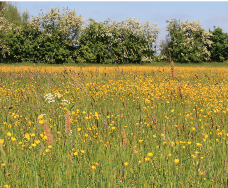
Abbildung 132: Artenreiches Feucht-Grünland in der Rheinaue Walsum

turschutz. Zusätzlich muss dringend auch das Potential derjenigen Bestände beachtet werden, die hinsichtlich des Arteninventars zwar nicht mehr vollständig ausgeprägt sind, deren Standortverhältnisse aber noch nicht verändert wurden.