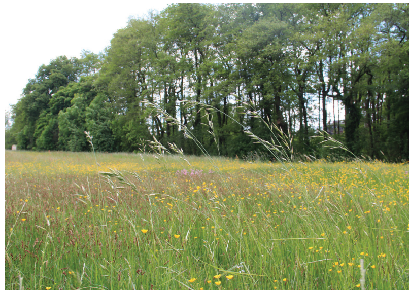
Abbildung 131: Grünland am Wambach

Im westlichen Ruhrgebiet existieren innerhalb der Gesamtheit der Bestände – die mehrheitlich degradierte Fragmentgesellschaften aufweisen – noch einige besser erhaltene Wiesen, die syntaxonomisch relativ gut angesprochen werden können. Hieraus lässt sich eine hohe Verantwortung für Flächenbesitzer, Bewirtschafteter und Naturschutzbehörden ableiten und es führt zu einer enormen Verantwortung für den regionalen Na-