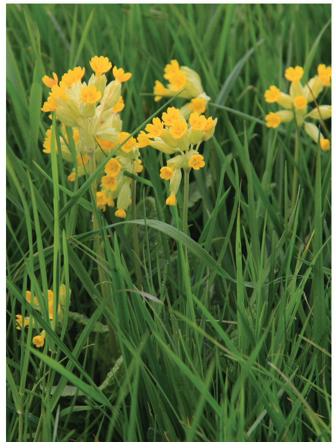
Abbildung 128: Wiesen-Schlüsselblume ( Primula veris )

Innerhalb der Feuchtwiesen sind in der Gruppe der Gräser und Grasartigen das Wollige Honiggras ( Holcus lanatus ), Flatter-Binse ( Juncus effusus ) und Wiesen-Ruchgras ( Anthoxanthum odoratum ) am häufigsten