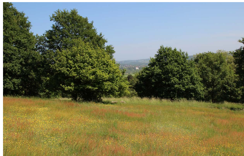
Abbildung 77: Der Magerrasen auf der Kuppe des Mintarder Bergs hat sich flächenmäßig ausgedehnt

Auf der Kuppe ist weiterhin eine positive Entwicklung zu verzeichnen. Der Bestand der Zielarten ist in einem konstant guten Erhaltungszustand, sodass sich kaum maßgebliche Änderungen in den Vegetationsaufnahmen ergeben. Es ist sogar zu beobachten, dass sich der Magerbereich, der optisch deutlich erkennbar von Flechten, niedrigwüchsigen Gräsern und dem hervorstechenden Kleinen Sauerampfer ( Rumex acetosella )