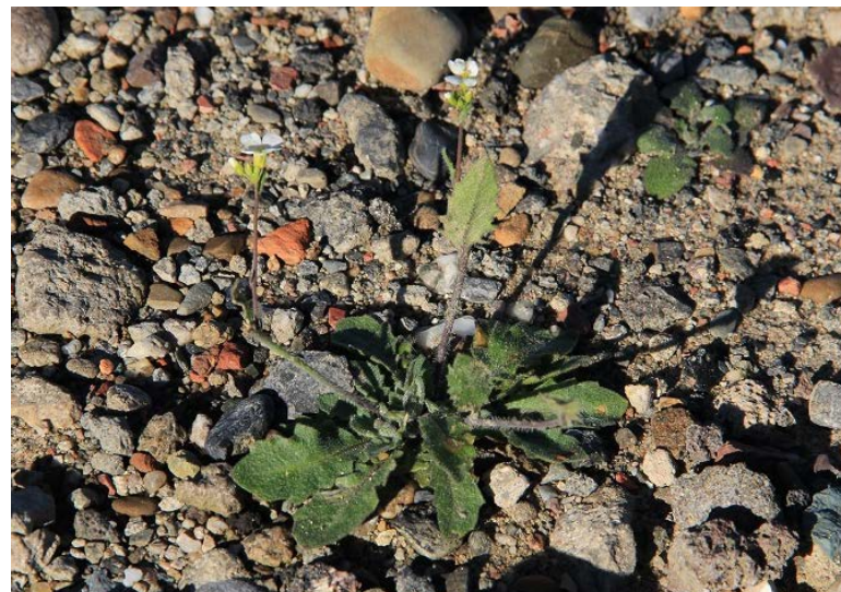
Abbildung 85: Die Sand-Schaumkresse gilt im Ruhrgebiet als Eisenbahnwanderer.

gerkeits- und Trockenheitszeiger. Sie ist eine Art der Sandtrockenrasen, tritt im Ruhrgebiet aber typischerweise auf Bahnbrachen auf, wie z.B. im Gleispark Frintrop in Essen. Auf dem RS1 kommt sie schwerpunktmäßig im Bereich zwischen der Stadtgrenze zu Essen (bzw. jenseits der Stadtgrenze auf Essener Stadtgebiet) und dem Heißener Bahnhof vor. Die Art besiedelt hier offene, vegetationsarme Standorte auf dem Mittel- und Randstreifen teils in großen Beständen. Es ist wünschenswert, aber auch zu erwarten, dass sich die Sand-Schaumkresse zukünftig noch weiter in Richtung Westen auf dem Radschnellweg ausbreitet. Im Bereich hinter der Hochschule Ruhr West, nahe der Stadtgrenze zu Duisburg, gibt es ebenfalls Fundpunkte der Art im Bereich der zukünftigen Trasse.