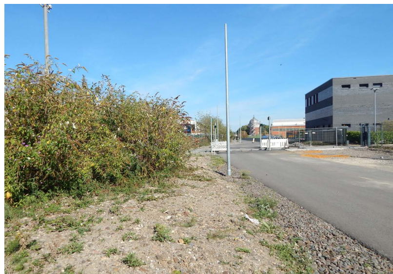
Abbildung 87: Lebensraum der Sandschrecke am RS1

Reptilien konnten abgesehen von einer toten Griechischen Landschildkröte ( Testudo hermanni ) nicht festgestellt werden. Ob das zuvor offensichtlich als Haustier gehaltene Exemplar bei der Aussetzung noch lebendig war und erst in Freiheit verstarb, kann nicht gesagt werden. Auffällige äußere Verletzungen waren nicht feststellbar, jedoch war das Tier schon länger tot, denn es wurde zum Fundzeitpunkt bereits stark von Wespen befallen.