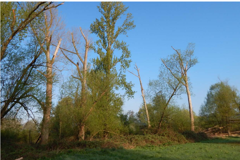
Abbildung 74: Auch 4 Jahre nach Ela sind die Veränderungen und Schäden noch gut zu sehen (17.04.).

„FFH-Gebiet Ruhraue in Mülheim“ erbrachte mindestens 47 besetzte Horste in der Saison 2018. In der Brutzeit erfolgten insgesamt sechs Kontrollen (05.03., 17.03., 27.03., 09.04., 24.04. und 03.05.), bei denen die sicher bzw. wahrscheinlich besetzten Graureiherhorste gezählt wurden. Bei allen Erfassungen wurde die Kolonie einmal im größtmöglichen Abstand vorsichtig umrundet und alle sichtbaren Nester erfasst. Somit war es meist möglich, ohne größere Störungen zu zählen, denn der überwiegende Teil der Reiher verblieb durchgehend auf bzw. an ihren Nestern. Dennoch auffliegende Tiere setzten sich oftmals in die unmittelbare Umgebung auf Nachbarbäume innerhalb der Kolonie und kehrten in der Regel innerhalb weniger Minuten zurück zum Nest.