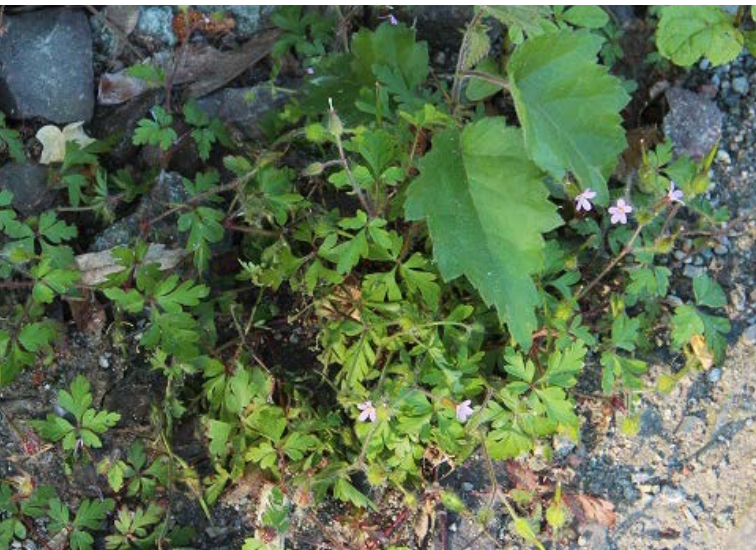
Abbildung 86: Auch der neophytische Purpur-Storchschnabel gilt als Eisenbahnwanderer

Flugfrüchte werden die Samen leicht durch Fahrtwinde verdriftet und die offenen, trocken-warmen Gleisschotter stellen einen optimalen Standort für die Art dar.