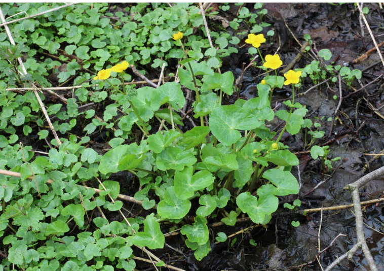
Abbildung 83: Sumpfdotterblume im Forstbachtal