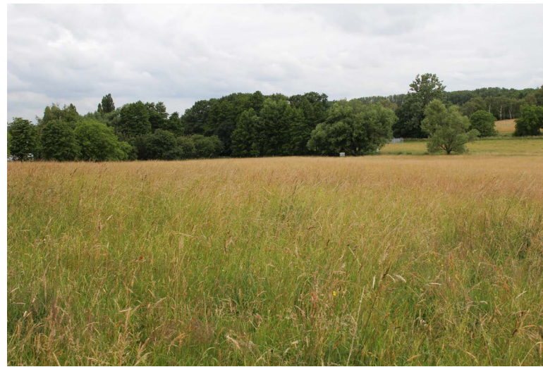
Abbildung 78: Blick von der mageren Kuppe der Rinderweide am Eschenbruch auf dem Auberg

Auf dem Auberg fand eine floristisch-vegetationskundliche Untersuchung der durch Heckrinder beweideten Fläche am Hang südlich des Eschenbruchs statt (Abbildung 78). Die Fläche wurde bis 2017 als Mäh-