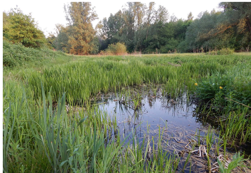
Abbildung 84: Ausgleichsgewässer im Winkhauser Tal am 14.05.

Wie bereits im Vorjahr gelangen auch auf dem Herbstdurchzug 2017 zahlreiche Wasserrallennachweise, welche die Attraktivität der Ausgleichsfläche unterstreichen. Zwischen dem 18.09.17 und 17.11.17 liegen an insgesamt 32 Tagen Fotonachweise vor. Insgesamt hat sich das Gewässer weiterhin positiv in Richtung eines mit Röhricht bestanden Flachgewässers entwickelt. Auch wenn die Vegetation im Winter 2017/18 erneut in großen Bereichen in sich zusammenfiel, war die Deckung mit neuem Aufwuchs an den Ufern und in den Flachwasserzonen bereits ab April deutlich ausgeprägter als in den Vorjahren und verlief auch im Mai weiterhin positiv (Abbildung 84). Das Potential der Fläche für eine zukünftige Brutansiedlung hat sich somit weiter erhöht.