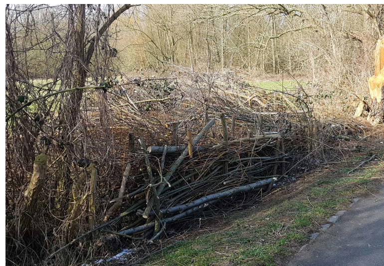
Abbildung 75: Die Fußgängerbarriere kurz nach ihrer Errichtung

Um die empfindlichen Grünlandbereiche der Saarer Ruhraue vor Tritt und Stickstoffeintrag durch Hunde und deren Nutzungsspuren zu schützen, beauftragte