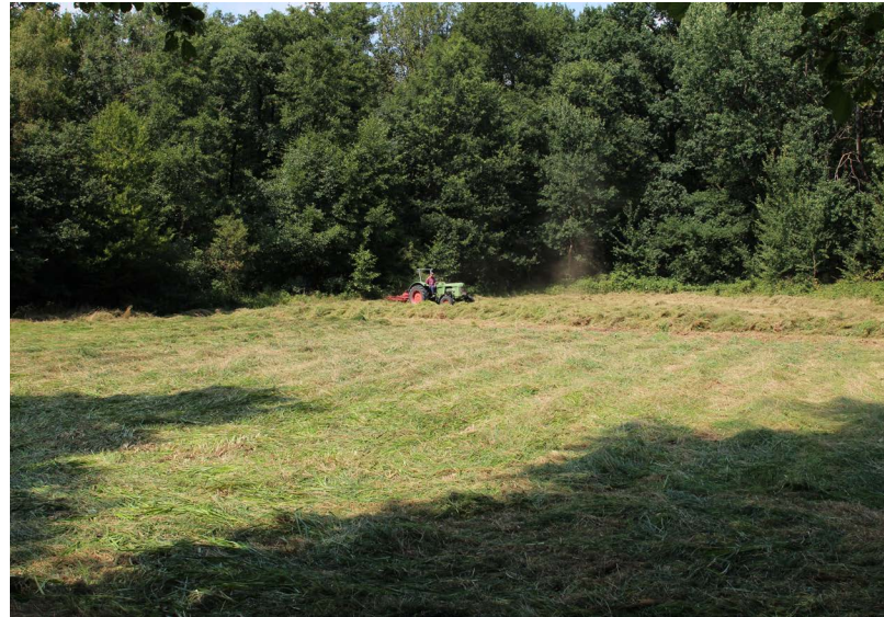
Abbildung 80: Die Orchideenwiese am Auberg nach der Mahd mit großem Gerät

Auf den beiden Dauermonitoringflächen wurden Vegetationsaufnahmen erhoben, die in einem späteren Bericht dargestellt werden. Wie sich die Witterung des Sommers auf den Orchideenbestand auswirkt, wird sich durch das Monitoring in den folgenden Jahren zeigen.