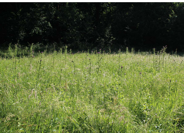
Abbildung 79: Im Mai zeigte sich die Orchideenwiese durch die warme Witterung besonders wüchsig.

Auf der Orchideenwiese am Auberg wurden im Mai 161 Exemplare des Gefleckten Knabenkrauts ( Dactylorhiza maculata , RL NRW S) gezählt. Im Vergleich zu den Vorjahren stellt diese Anzahl weiterhin eine abnehmende Tendenz dar, sodass Maßnahmen zur Förderung der Art ergriffen werden müssen, die auch die Situation der weiteren Feuchtwiesenarten vor Ort begünstigen (s. Kapitel 7.4.3). Insbesondere fällt die Hochwüchsigkeit der Wiese auf (Abbildung 79) und dass die untere Grasschicht der Wiese eine filzige Matte aus Hundsstraußgras ( Agrostis canina , RL NRW V) und Wolligem Honiggras ( Holcus lanatus ) bildet, die möglicherweise die Keimung und das Wachstum der Beikräuter hemmt.