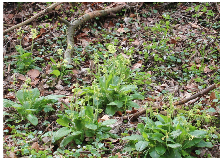
Abbildung 82: Hohe Primel in einem Feuchtwald im Forstbachtal

Jedoch ergaben sich in dieser Hinsicht nur wenige Neuerungen, denn das Gebiet ist seit den Anfangsjahren der Biologischen Station im Fokus und dadurch bereits gut untersucht. Trotz zahlreicher Störungen durch intensive Freizeitnutzung sind die Bestände der wertgebenden Arten in ihrer Gesamtheit noch relativ gut erhalten und in einem stabilen Zustand.