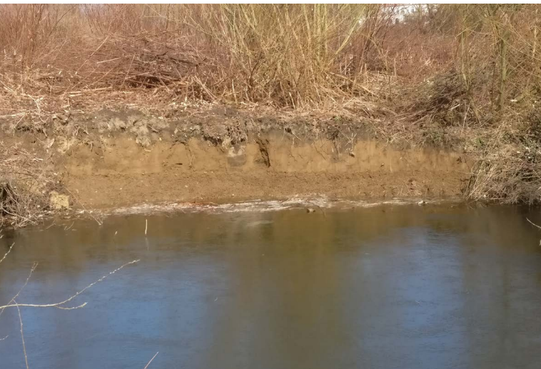
Abbildung 76: Die Eisvogelwand in der Saarner Ruhraue nach der Freistellung

Zudem wurde Anfang des Jahres die Eisvogelwand am Holunderweg großflächig freigestellt und von kleineren Gehölzen und Brombeeren befreit (Abbildung 76). Die Steilwand, welche unmittelbar an der Wasserkante liegt, musste außerdem im gesamten Bereich erneut abgestochen werden. Das direkte Umfeld der Eisvogelwand wurde außerdem vom Neophytenbestand des Staudenknöterichs ( Fallopia japonica ) befreit.