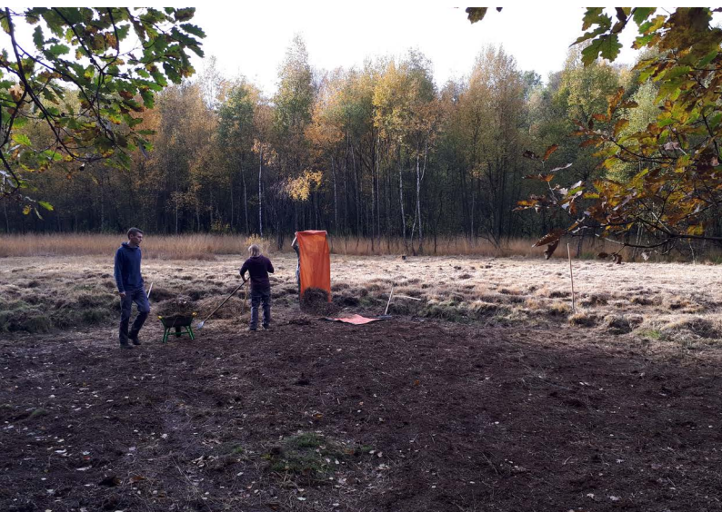
Abbildung 81: Das Oembergmoor nach der Maßnahme

Die Maßnahmen dienen der Erhaltung des Magerstandorts und der Torfmoose. Eine extensive Beweidung (5–10 Tage im Jahr), die bereits seit 2016 angestrebt wird, konnte auch in diesem Jahr nicht umgesetzt werden, wird aber weiterhin als ideal angesehen.