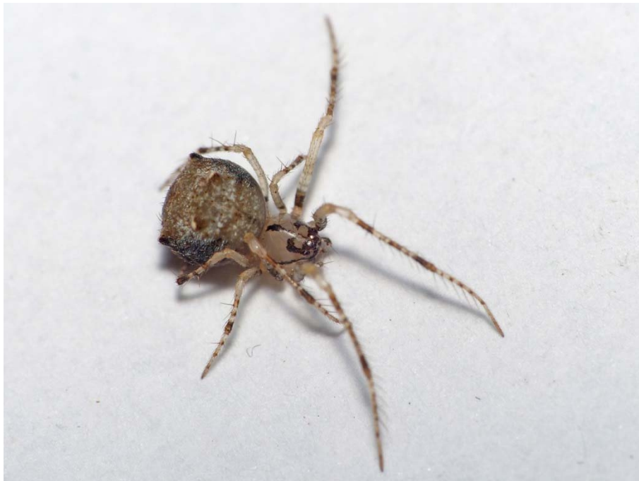
Abb. 5: Ero aphana (Vierhöcker-Spinnenfresser), Weibchen aus Essen-Kettwig (Wohnungsfund), TK 4607, 30.7.2013.