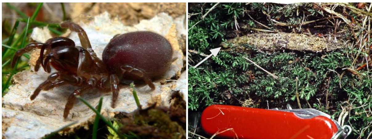
Abb. 2 und 3. Links: Atypus affinis (Gemeine Tapezierspinne), Weibchen aus Essen-Schuir (Ruthertal), TK 4607, 1.4.2007. Rechts: Oberirdischer Teil der Wohnröhre („Fangschlauch“); der Pfeil bezeichnet die Stelle, wo der dem Moos aufliegende „Fangschlauch“ in den unterirdischen Teil der Wohnröhre übergeht. Fundort wie Abb. 2, 1.4.2001.

Tapezierspinnen, von denen es in Deutschland drei Arten gibt, zählen als einzige heimische Webspinnen zur Unterordnung Vogelspinnenartige (Mygalomorphae). In Westdeutschland ist Atypus affinis die am häufigsten gefundene Art des Triplets (Arachnologische Gesellschaft 2020). Tapezierspinnen werden, ohne die mächtigen, wie bei allen Mygalomorphae in Körperlängsachse (orthognath) stehenden Cheliceren gerechnet, bis zu 15 mm lang. Die Beine sind kurz und kräftig. Damit können die Spinnen rasch in ihren selbstgegrabenen und mit Spinnseide ausgeschlagenen („tapezierten“) Erdröhren laufen. An der Erdoberfläche liegt das Ende des Gespinstes als mit Bodenpartikeln getarnter Schlauch dem Substrat auf (Abb. 3). Kleine Gliederfüßer (z.B. Käfer, Asseln), die über den Schlauch krabbeln, werden von Atypus mit den sehr langen Kieferklauen gepackt und in den Schlauch gezogen. Atypus -Spinnen gelten als wärmeliebend, typische Lebensräume seien daher (Fels-)Trockenrasen, Heidegebiete und offene Kiefernwälder (Nentwig et al. 2020). Diese Lebensräume sind schon selten und/oder nehmen an Fläche weiter ab, daher steht A. affinis auf der Roten Liste für Deutschland in der Vorwarnstufe (Blick et al. 2016). In Essen fanden wir sie aber auch an zum Teil stark überschirmten Waldstandorten vor, etwa an Hohlwegen im Ruthertal (Schuir) und im Oeffter Wald (Kettwig) oder an Böschungen im (sturmgeschädigten) Schellenberger Wald (Heisingen).