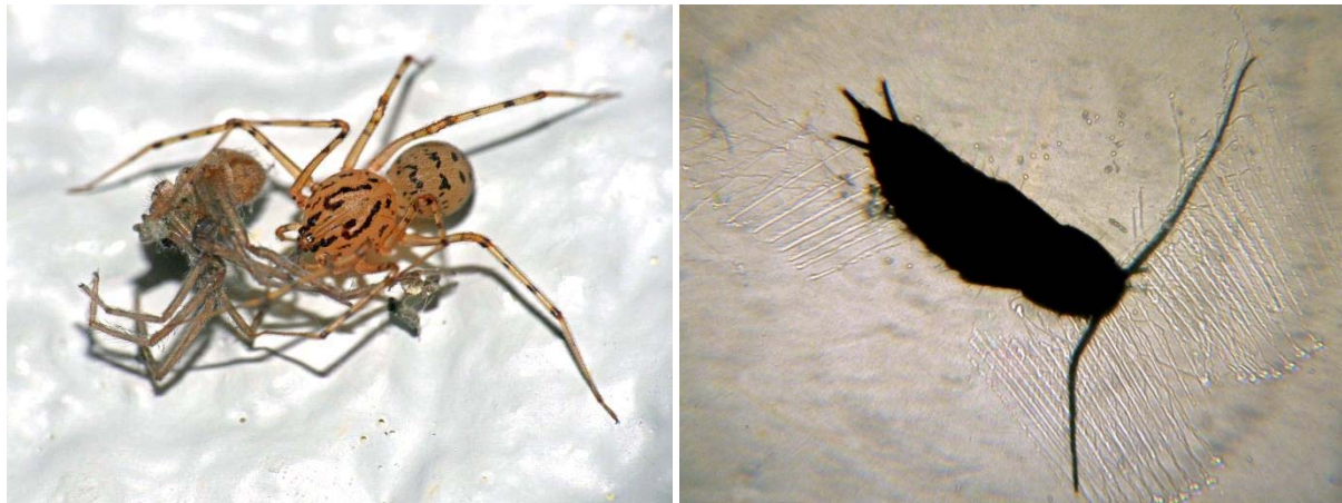
Abb. 7 und 8. Links: Scytodes thoracica (Gewöhnliche Speispinne) mit erbeuteter Spinne, Essen-Kettwig, TK 4607, 19.9.2015. Rechts: Von Speispinne erbeutetes Silberfischchen ( Lepisma saccharina), beachte das zickzackförmige „Spuckmuster“ der Klebfäden, Essen-Rüttenscheid, TK 4508, Oktober 1998.