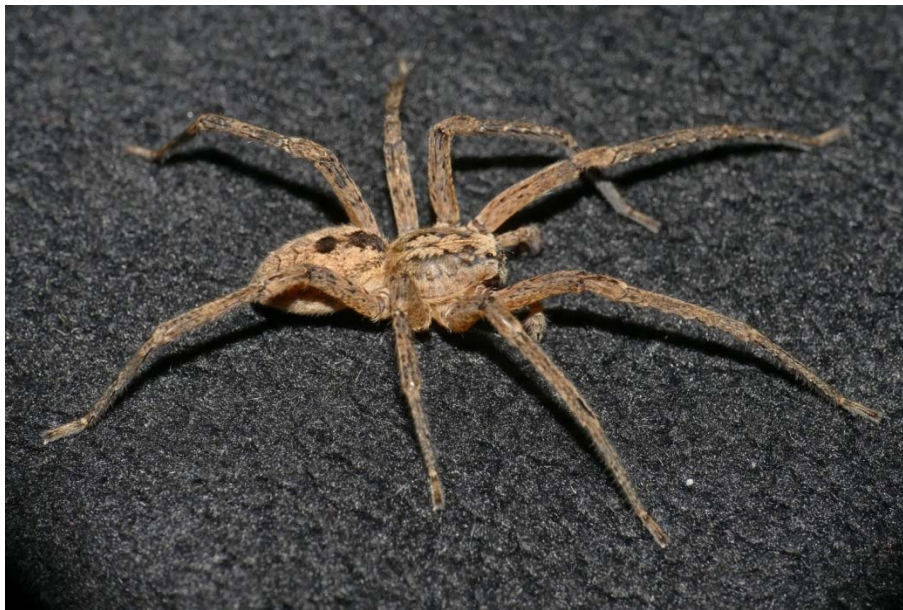
Abb. 10: Zoropsis spinimana (Nosferatu-Spinne), Männchen aus Essen-Kupferdreh, TK 4608, Oktober 2017.

hat ihr vor etwa 10 Jahren, als sich die ersten Funde der Art zunächst am Oberrhein (Hänggi & Bolzern 2006), später auch am Niederrhein (Arachnologische Gesellschaft 2020) häuften, eine gewisse Aufmerksamkeit in den Boulevardmedien verschafft, wo sie unreflektiert und unzutreffend als „angriffslustige Giftspinne“ hingestellt wurde. Tatsächlich ist die Giftwirkung eines Bisses gering (Hänggi & Zürcher 2013). Zoropsis spinimana ist nachtaktiv und baut kein Fangnetz, sondern lauert an erfolgversprechenden Punkten auf vorbeikommende Gliederfüßer. Den Tag verbringt sie in einem Wohnspinnst an geschützter Stelle. Die Entwicklung dieser großen Spinne erfolgt überraschend schnell, vom Schlupf bis zur Geschlechtsreife vergeht kein Jahr, das Höchstalter beträgt 1,5 Jahre (Hänggi & Zürcher 2013). Bei uns lebt die Art synanthrop, etwa in Kellern oder Garagen, so dass sie gelegentlich, ähnlich manchen Winkelspinnen (z.B. Eratigena atrica , Tegenaria domestica ), auch in Wohnungen vordringt. Ein sich solchermaßen verhaltendes Exemplar aus Essen-Kupferdreh wurde uns im Oktober 2017 vorgelegt. Es ist bisher ein Einzelfund für die hier besprochene Region geblieben. Die nächstgelegenen Fundmeldungen stammen aus Düsseldorf, Erstfund 2008, und Dortmund, Erstfund 2018 (Arachnologische Gesellschaft 2020).