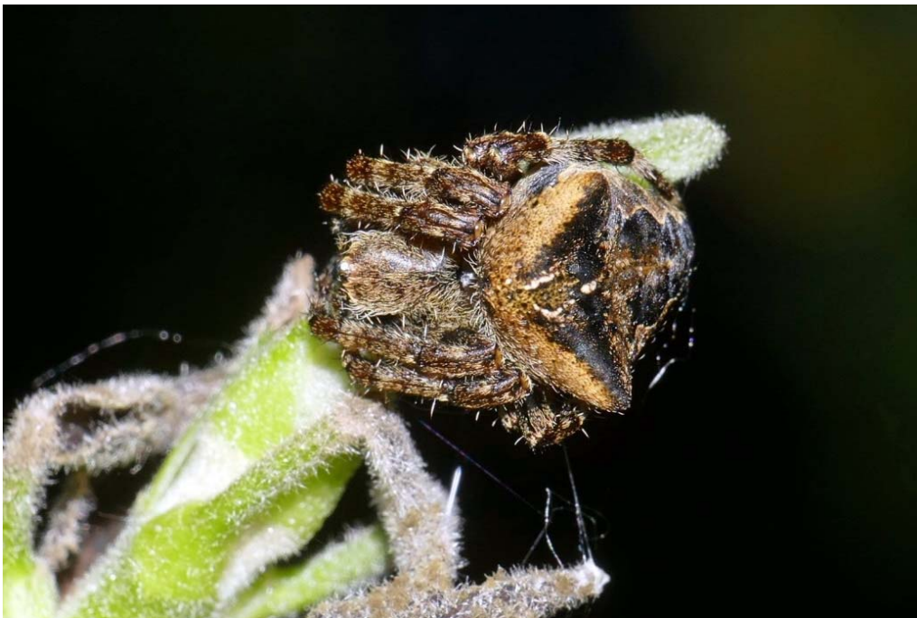
Abb. 1: Araneus angulatus (Gehörnte Kreuzspinne), Weibchen aus Ratingen-Hösel, TK 4607, 25.5.2017.