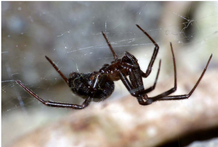
Abb. 9: Steatoda grossa (Große Fettspinne), Weibchen aus dem Sukkulentehaus des Gruga-Parks, Essen, TK 4507, 14.10.2012.

Auch Steatoda grossa ist eine ursprünglich südeuropäisch-asiatische Art, inzwischen aber kosmopolitisch verbreitet (World Spider Catalog 2020). Adulte Weibchen werden bis zu 10 mm lang. Reife Männchen bleiben, wie bei den meisten Spinnen, deutlich kleiner und werden nur etwa halb so groß. Diese Kugelspinne wird bei uns meistens in und an Häusern gefunden. Es gibt sie unter anderem im Wüstenhaus des Gruga-Parks in Essen, jedoch auch in Kellerfensterschächten (innen und außen) in den Essener Stadtteilen Altendorf, Kettwig, Frohnhausen und Rüttenscheid. Die Färbung ist variabel, Männchen und jüngere Weibchen tragen auf dem Hinterleibrücken mehrere helle Flecken. Ältere Weibchen, wie in Abbildung 9, sind dunkelviolet, fast schwarz. Wie bei allen großen Kugelspinnen ist das Fangnetz von S. grossa aus ziemlich festen Fäden aufgebaut. Im englischen Sprachraum werden große Steatoda -Arten als „false widows“ bezeichnet, als Falsche Witwen, weil sie den Giftspinnen des Schwarze-Wit-