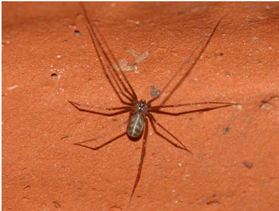
Abb. 6: Psilochorus simoni (Simons Zitterspinne) aus Essen-Frohnhausen, TK 4507, 9.1.2020.

Bei dieser Zitterspinne liegt die Sache ähnlich wie bei vorgenannter Art: Sie ist wahrscheinlich häufiger als es die bekannt gewordenen Fundmeldungen (Arachnologische Gesellschaft 2020) anzeigen. Psilochorus simoni ist eine der kleinsten Zitterspinnen Europas, selbst Adulti werden nur 2 bis 3 mm lang. Sie ist schon deshalb leicht zu übersehen. Außerdem gleicht sie Jungtieren der Großen Zitterspinne, besitzt allerdings, anders als diese, einen eher kugelförmigen, blau-grünlichen Hinterleib und relativ kürzere Beine. Ursprünglich ist P. simoni eine nordamerikanische Spezies (Nentwig et al. 2020). Wie bei Pholciden in Mitteleuropa üblich, sucht auch P. simoni ganz