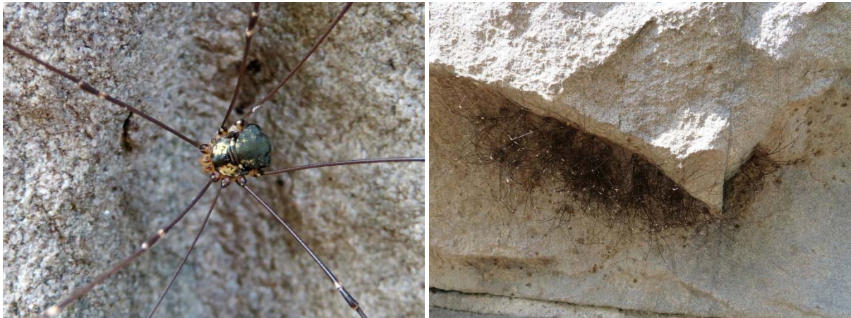
Abb. 12 und 13. Links: Männchen von Leiobunum sp. A aus Mülheim an der Ruhr, TK 4507, 22.7.2017. Rechts: Leiobunum -Aggregation während der Tagesruhe (Fundort und -zeit wie Abb. 12;).