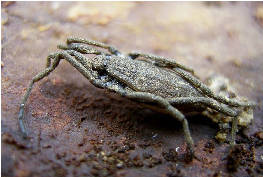
Abb. 14: Weibchen des Brettkankers Trogulus closanicus (Verkannter Brettkanker), Exemplar aus der Gegend von Nijmegen (Provinz Gelderland, Niederlande), 12.3.2004.