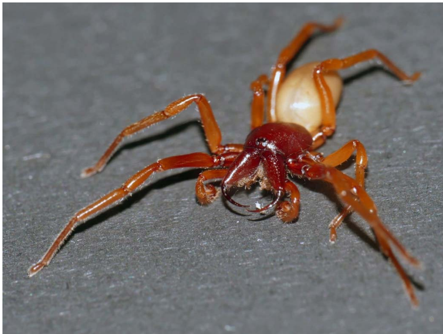
Abb. 4: Dysdera crocata (Großer Asseljäger), drohendes Männchen aus Essen-Kettwig, TK 4607, 26.11.2019.