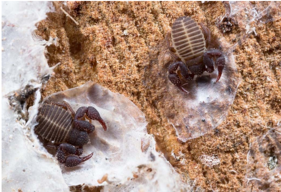
Abb. 15: Zwei Exemplare des augenlosen Pseudoskorpions Chernes hahnii in ihren Schutzgespinsten unter eröffneter Platanenborke, Essen-Südviertel (Huysseallee), TK 4508, 17.11.2019.

Anzahl bestätigt. Zu beobachten sind in diesem Falle oft größere Kolonien von eng beieinanderliegenden Nestgespinsten. Obwohl zahlreiche Platanen im Essener Stadtgebiet untersucht wurden, konnte C. hahnii bislang erst einmal an der Huysseallee im Südviertel bestätigt werden.